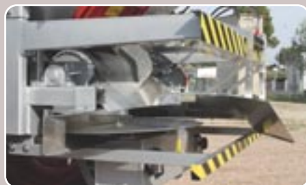
25 Bordeador BLS Border spreading system BLS