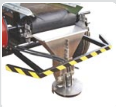
47 Disco bajo para distribución de sal Salt spreading low disc