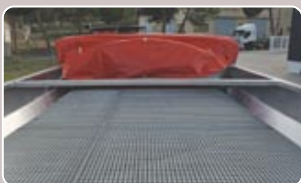
30 Malla criba alta High galvanized sieve