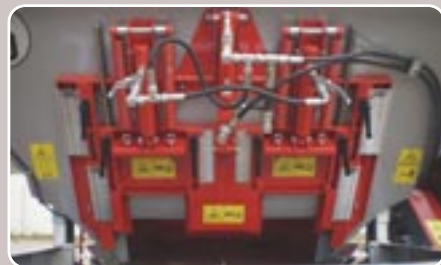
23 Triple compuerta hidráulica abono-compost Triple hydraulic fertilizer-compost feeding gate