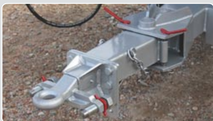
52 Lanza giratoria articulada Articulated draw-bar