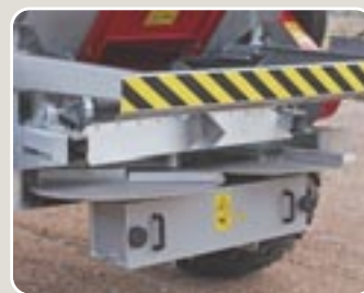
17 Discos esparcidores de acero inoxidable de \phi 700 mm 700 mm spreading stainless steel discs