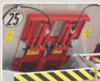
15 Doble compuerta de accionamiento hidráulico Double feeding gate hydraulic driven