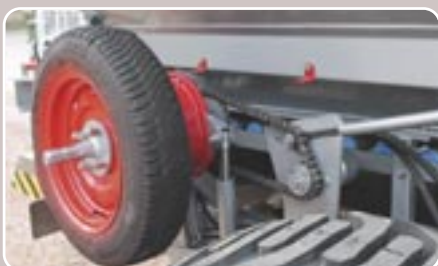
27 Accionamiento hidráulico de la cinta Hydraulic driven feeding belt