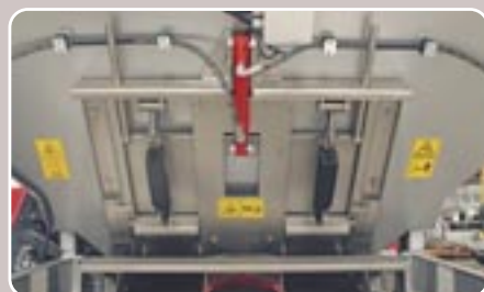
29 Doble compuerta hidráulica con regulación eléctrica Double hydraulic feeding gate with electric regulation