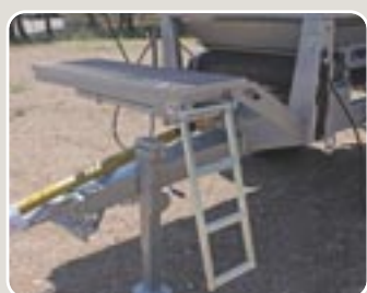
13 Plataforma delantera con escalera Frontal platform with ladder