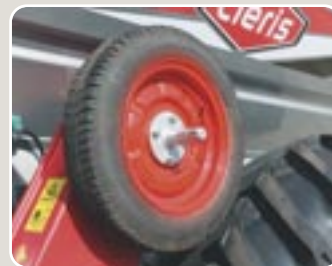
8 Descargador de tolva en parado, accionado por cardán Quick unloader of hopper actuated by cardan