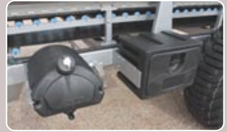
35 Bidón de agua - caja de herramientas Water can - toolbox