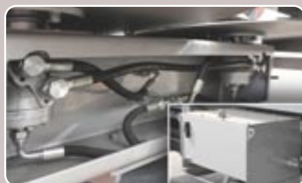
28 Discos de accionamiento hidráulico con o sin depósito Hydraulic driven distributing discs