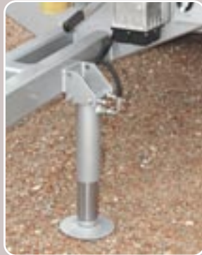
37 Pie hidráulico Hydraulic parking jack