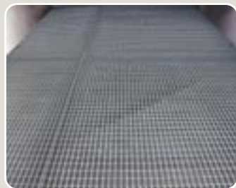
6 Malla criba galvanizada de paso reducido Reinforced galvanized sieve with tiny hole