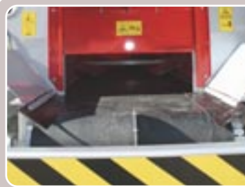
20 Compuerta ancho para especial compost Compost extra wide feeding gate