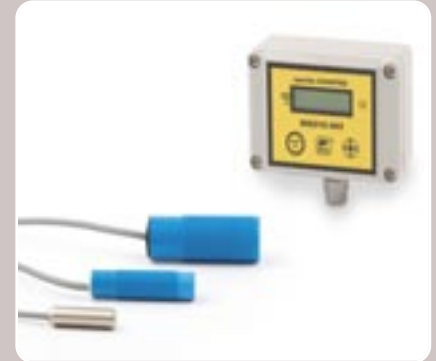
39 Cuenta RPM RPM counter