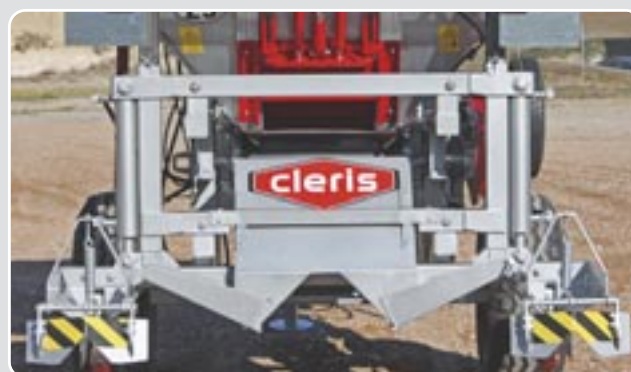
46 Dispositivo localizador rejón doble Double burying device