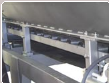
43 Rodillos de acero inoxidable Stainless steel rollers