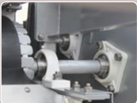
42 Rodamientos de acero inoxidable Stainless steel bearings