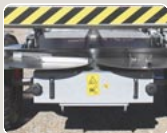
10 Discos esparcidores de \phi 600 mm y protector de acero inoxidable 600 mm stainless steel spreading discs and protector