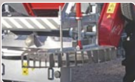
24 Bordeador BLX Border spreading system BLX