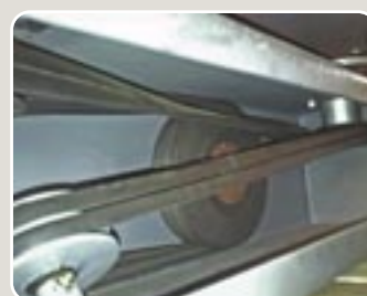
16 Grupo distribuidor de doble correa a 875 rpm 875 rpm double belt distributing group