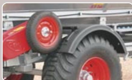
31 Guardabarros Mudguards