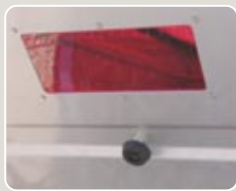
2 Visor delantero de metacrilato Frontal methacrylate viewfinder