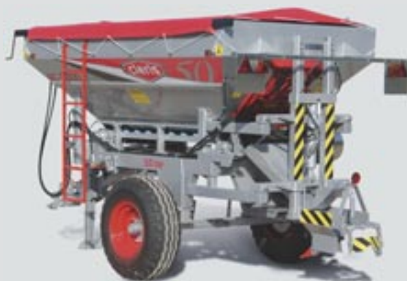
45 Dispositivo localizador rejón simple Simple burying device