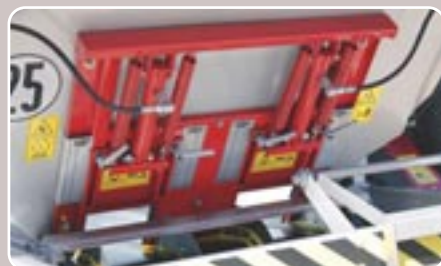
26 Doble compuerta hidráulica Double hydraulic feeding gate