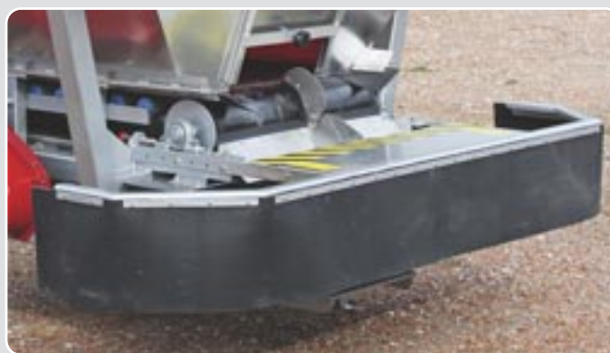
51 Faldón limitador del ancho de trabajo Working width limiter talil skirt