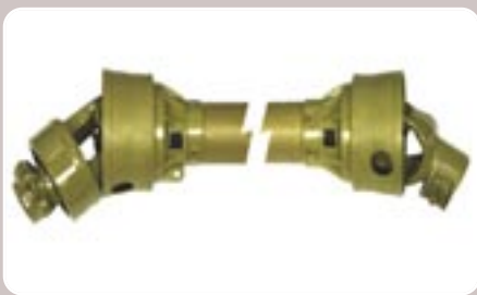
18 Transmisión cardán de rueda libre Free-wheel joint cardan shaft