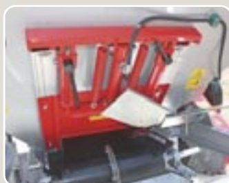
11 Cierre manual para trabajos en bordes de acero inoxidable Manual border shutoff in stainless steel