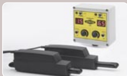
32 Apertura eléctrica de la dosificación Electronic spreading rate opening control