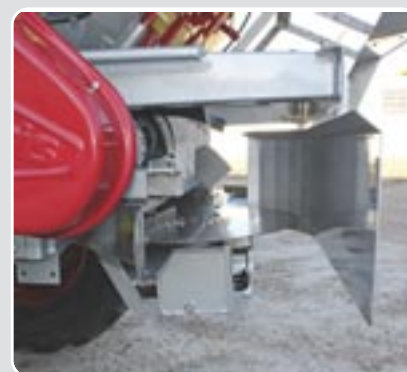
49 Dispositivo localizador lateral Side deflector device