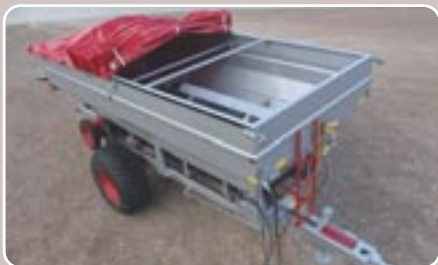
21 Toldo retráctil Retractable tarpaulin cover