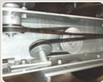
7 Grupo distribuidor de simple correa a 780 rpm 780 rpm simple belt distributing group