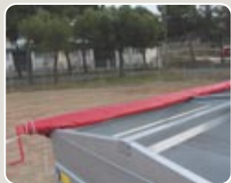
5 Toldo abatible, tipo camión con arquillos de chapa plegada Lorry type folding tarpaulin with folded sheet cover