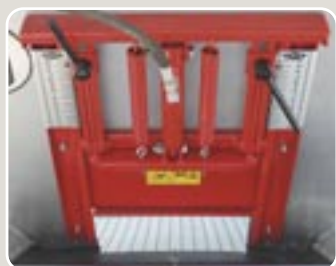
9 Simple compuerta de accionamiento hidráulico Simple feeding gate hydraulic driven