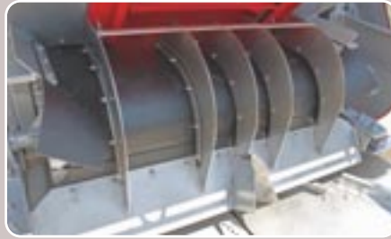
34 Bajante antiladeras de acero inoxidable Stainless steel anti-hillsides