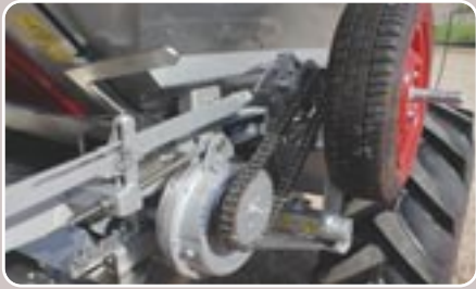
33 Grupo reductor de dos velocidades Two speeds gearbox