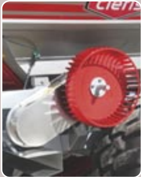
36 Rueda de transmisión metálica Iron land-wheel