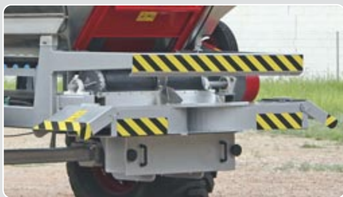
50 Localizador lateral para arbolado y viña Side deflector device for archard and vineyard