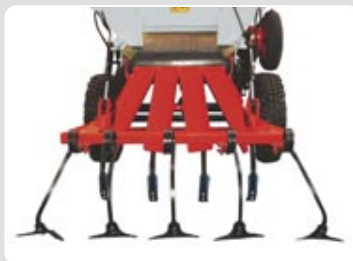
48 Dispositivo enterrador superficial posterior con rastrillo Rear burying device with cultivator shanks