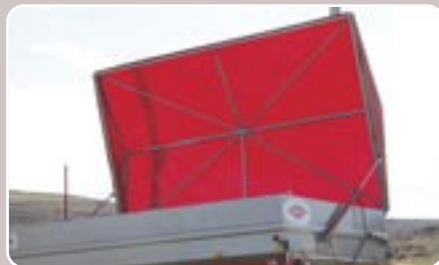
22 Toldo hidráulico Hydraulic tarpaulin cover