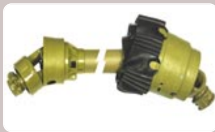
19 Transmisión con nudo homocinético y rueda libre Homokinetic joint cardan shaft and freewheel