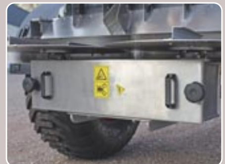
44 Caja de poleas de acero inoxidable Stainless steel pulley box