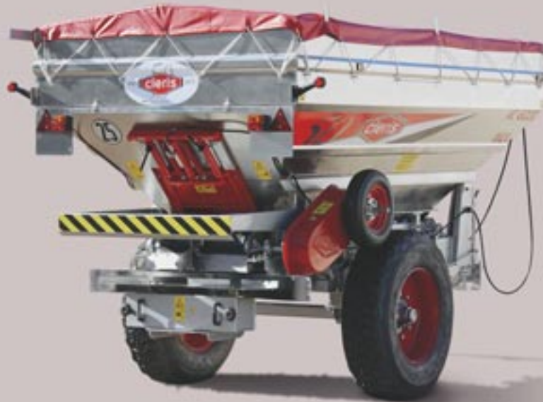
41 Chasis de acero inoxidable Stainless steel chassis