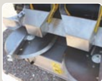
14 Discos AC450, bajante DPL y protector de acero inoxidable AC450 discs, dpl slope and stainless steel protector