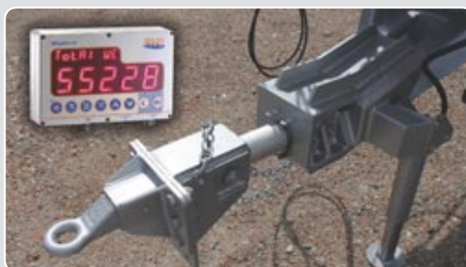
53 Báscula Weighing scale