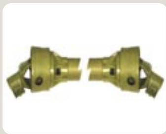
1 Transmisión cardán Cardan shaft