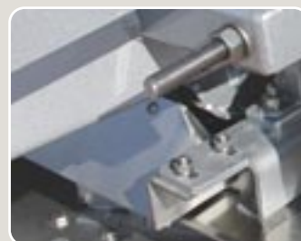
12 Tornillería de acero inoxidable Stainless steel screw