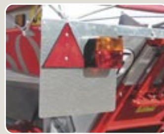
4 Equipo de luces completo Lights and electrical equipment